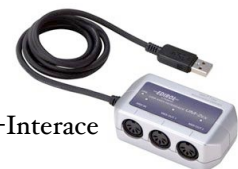
ein einfaches MIDI-Interface

Soll an den Computer ein externes Keyboard angeschlossen werden, so benötigt der Rechner zwei MIDI-Anschlüsse (in, out, auf thru kann verzichtet werden). Gute Soundkarten haben so etwas. Wenn diese Anschlüsse fehlen, kommt das MIDI-Interface zum Einsatz, ein Zusatzgerät, das diese Anschlüsse besitzt und in andere Formate (zum Beispiel USB) wandeln kann, die der Computer wieder versteht.